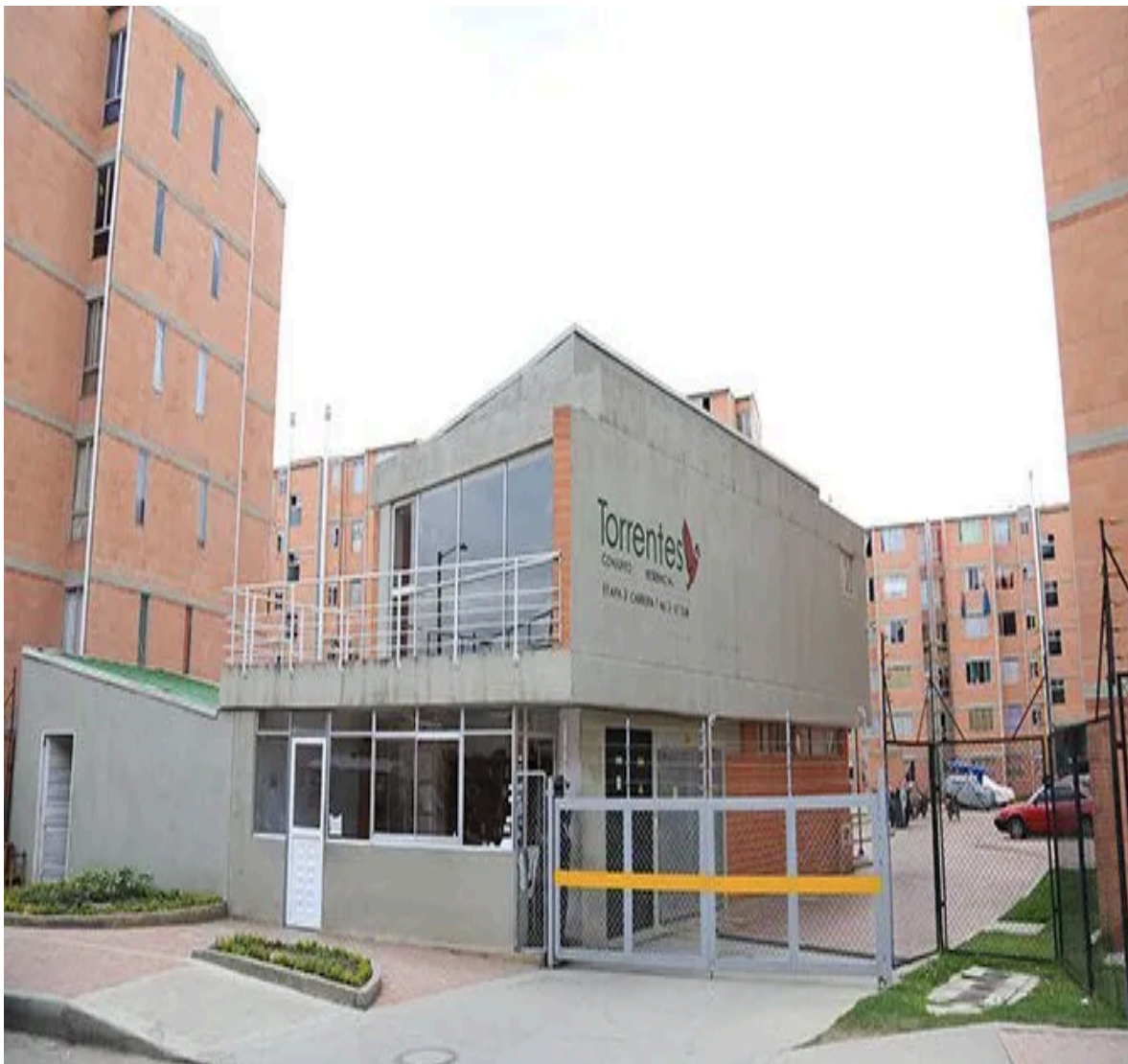
IMAGEN DEL TERRITORIO